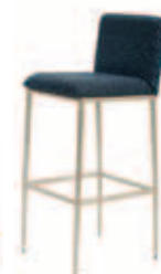
Banqueta Classic Alumínio