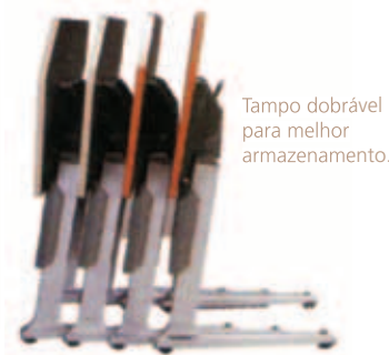
Tampo dobrável para melhor armazenamento.