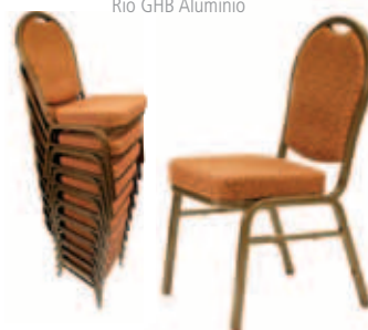
Rio GHB Alumínio