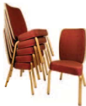
Barra Leblon Alumínio