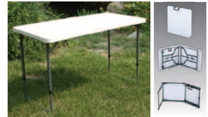
Tampo confeccionado em Polipropileno, estrutura dobrável em aço. Pintura com tinta em pó pelo sistema eletrostático na cor a definir. Com tratamento anti-corrosivo à base de fosfato de zinco refinado.