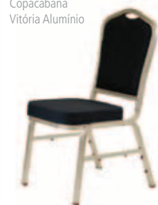
Copacabana Vitória Alumínio