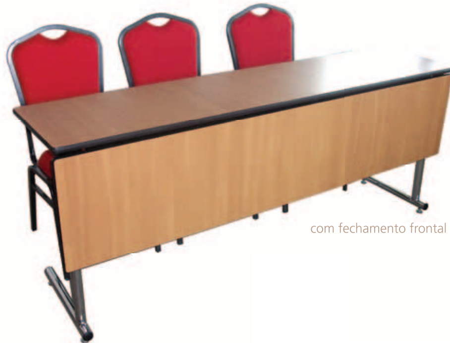
com fechamento frontal