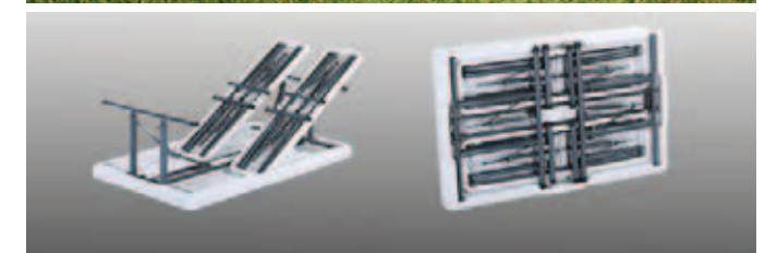
Tampo confeccionado em Polipropileno, estrutura dobrável em aço. Pintura com tinta em pó pelo sistema eletrostático na cor a definir. Com tratamento anti-corrosivo à base de fosfato de zinco refinado.