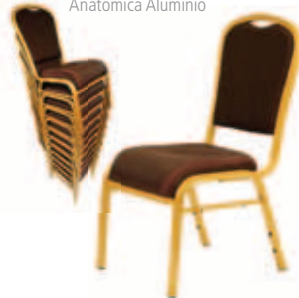
Copacabana Anatômica Alumínio