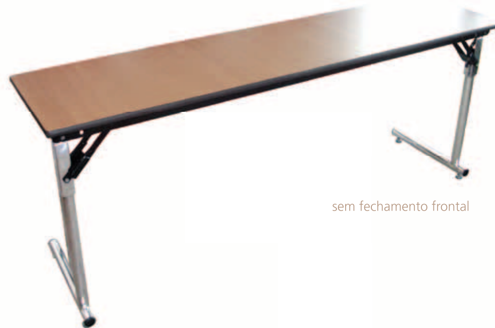
sem fechamento frontal