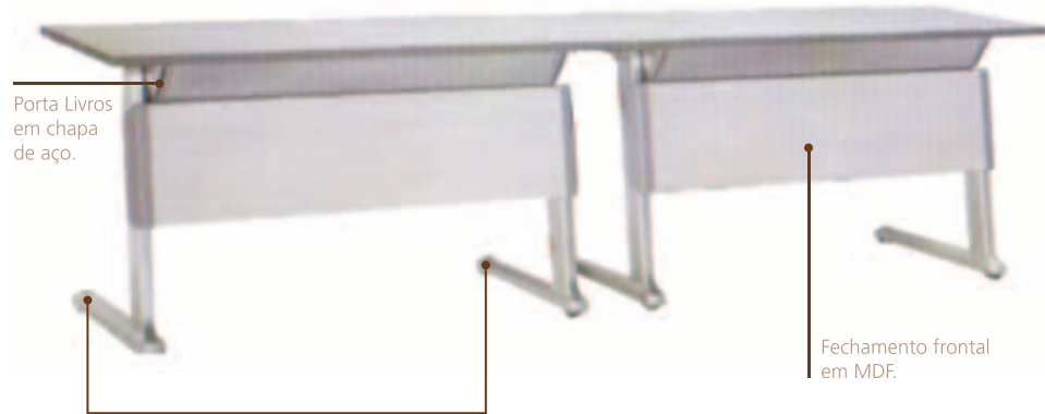
Porta Livros em chapa de aço.